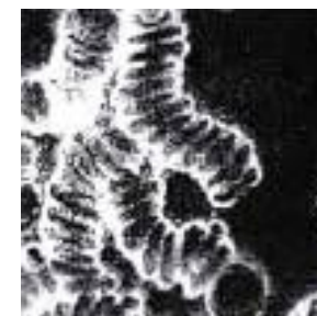
vor einer Krankheit

Zustand von menschlichen Blutzellen unter Anwendung von Dunkelfeldmikroskopie vor und nach dem Trinken von mit AQUA POWER JOINT aktiviertem Wasser