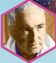
Dr. Wilhelm Reich

Der Anfang der Biophysik spielte eine entscheidende Rolle für das Verständnis des Wesens des Lebenden. Dr. Wilhelm Reich bewies als Erster die Existenz überall um uns herum eines unausschöpfbaren Ozeans von Energie, die er "Orgon" nannte. Er stellt auch fest, dass organische Materialien Orgon akkumulieren, wohingegen die anorganischen Orgon widerspiegeln. Später zeigte Reich mit der Erfindung des Orgongenerators auch die den richtigen Nutzen seiner Entdeckungen für die Menschen.