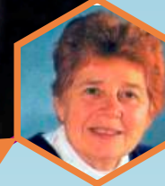
Dr. Hulda Clark

Erstens: Die Entdeckung der Matrix des Lebens – des Informationswassers. Zweitens: Die Fähigkeit dieses Wassers kontaktlos auf jede Flüssigkeit zu wirken – der Prozess der Wasserbelebung.