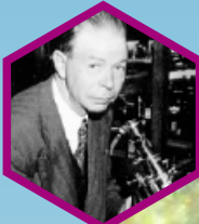
Dr. Royal Rife

Jede lebende Zelle hat ihre eigene Schwingungsfrequenz. Dr. Royal Raymond Rife registrierte in den 1930-ern als Erster die Frequenzen von über 150 000 Parasitenformen – Bakterien, Pilzen und Viren. Er schuf auch eine Methode auf der Grundlage der Resonanz um nur die Pathogene zu vernichten ohne die gesunden Zellen und Organe zu beschädigen.