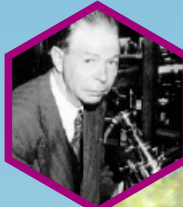
Dr. Royal Rife

Jede lebende Zelle hat ihre eigene Schwingungsfrequenz. Dr. Royal Raymond Rife registrierte in den 1930-ern als Erster die Frequenzen von über 150 000 Parasitenformen – Bakterien, Pilzen und Viren. Er schuf auch eine Methode auf der Grundlage der Resonanz um nur die Pathogene zu vernichten ohne die gesunden Zellen und Organe zu beschädigen.