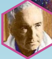
Dr. Wilhelm Reich

Der Anfang der Biophysik spielte eine entscheidende Rolle für das Verständnis des Wesens des Lebenden. Dr. Wilhelm Reich bewies als Erster die Existenz überall um uns herum eines unausschöpfbaren Ozeans von Energie, die er "Orgon" nannte. Er stellt auch fest, dass organische Materialien Orgon akkumulieren, wohingegen die anorganischen Orgon widerspiegeln. Später zeigte Reich mit der Erfindung des Orgongenerators auch die den richtigen Nutzen seiner Entdeckungen für die Menschen.