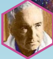
Dr. Wilhelm Reich

Der Anfang der Biophysik spielte eine entscheidende Rolle für das Verständnis des Wesens des Lebenden. Dr. Wilhelm Reich bewies als Erster die Existenz überall um uns herum eines unausschöpfbaren Ozeans von Energie, die er "Orgon" nannte. Er stellt auch fest, dass organische Materialien Orgon akkumulieren, wohingegen die anorganischen Orgon widerspiegeln. Später zeigte Reich mit der Erfindung des Orgongenerators auch die den richtigen Nutzen seiner Entdeckungen für die Menschen.